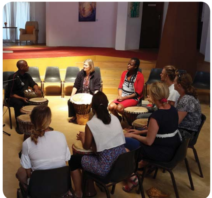
Föreningen SOFIA och Novalis Ubuntu Institute har samarbetat i många år. Bilden ovan är från en studieresa som SOFIA gjorde under 2014 till Kapstaden.

Mellan seminarierna finns det möjlighet att fortsätta diskussionen och ställa frågor som dyker upp via ett diskussionsforum på internet.